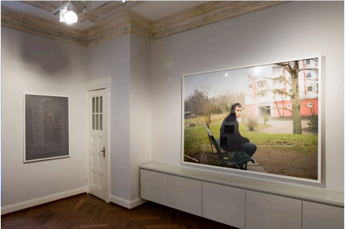
DIRTY MINIMAL #71.4.1 UND / AND #71.4.11 , 2013 — BE / BECOME , 2013 Light-Jet-Print, 156 x 206 cm / Pigment-Print, 126 x 86 cm, Auflage / edition : 3 + 2 A.P. Hamburg Kirchdorf-Süd