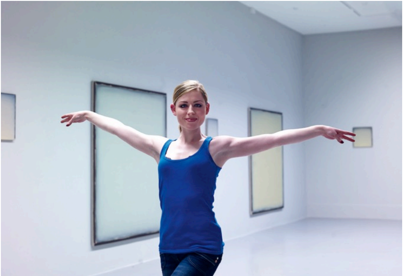
DIRTY MINIMAL #59.1.3 – ETERNAL NOW (SCULPTURE/ ENTERTAINMENT), 2008/09, Light-Jet-Print, 166 x 226 cm, Auflage / edition: 3 + 2 A.P. Irish Museum of Modern Art und / and Fosset's Irish National Circus, Dublin