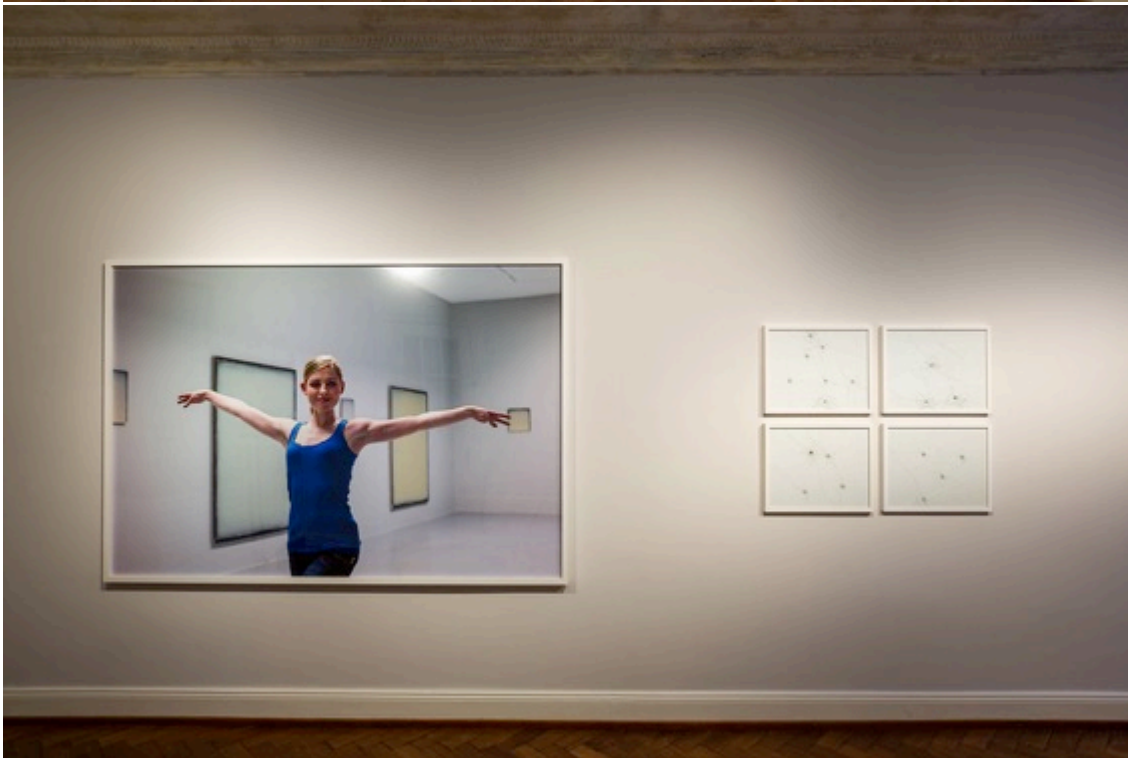
Ausstellungsansichten / installation views