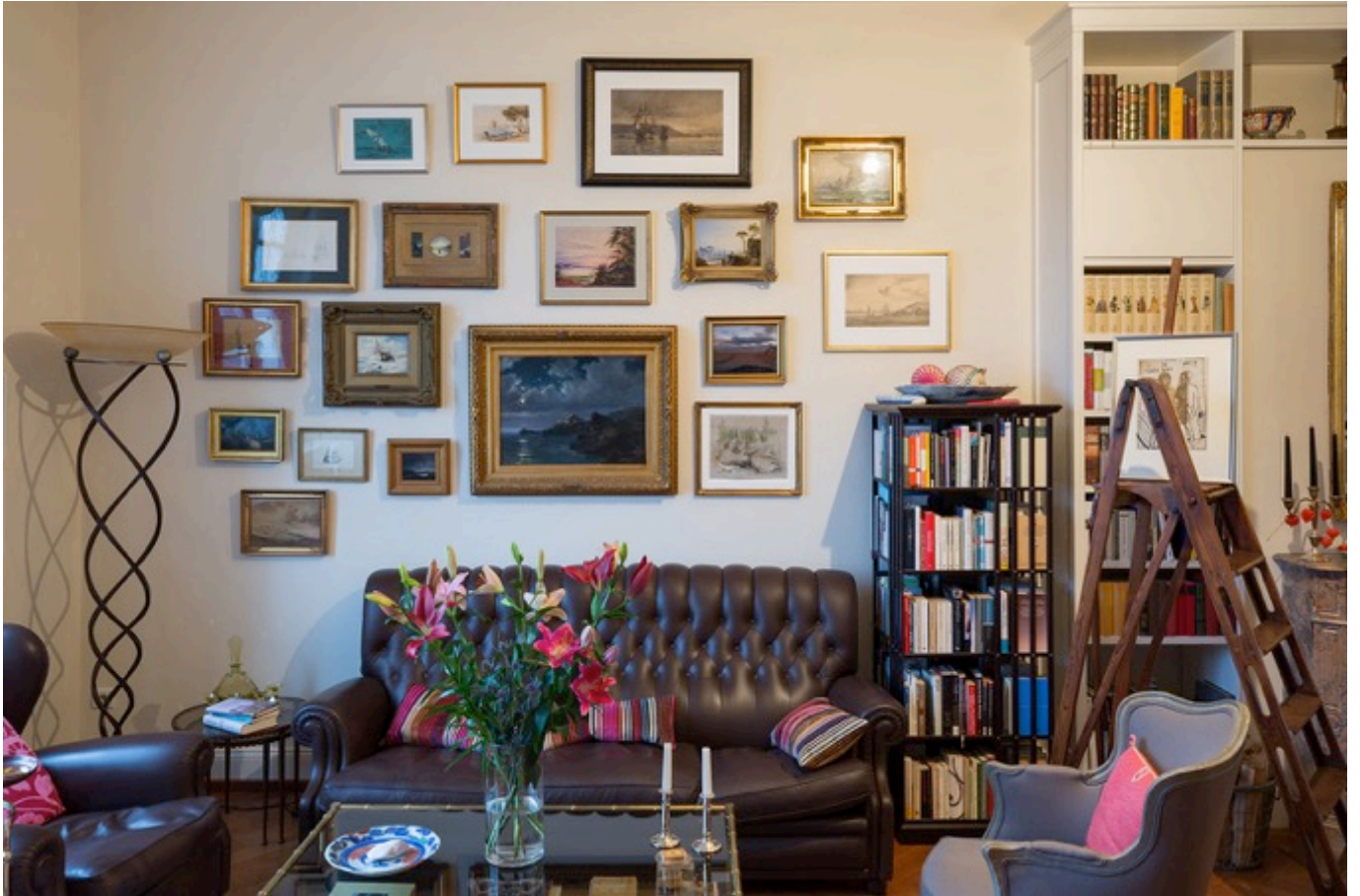
Wohnzimmer / living room Ausstellungsansicht / installation view