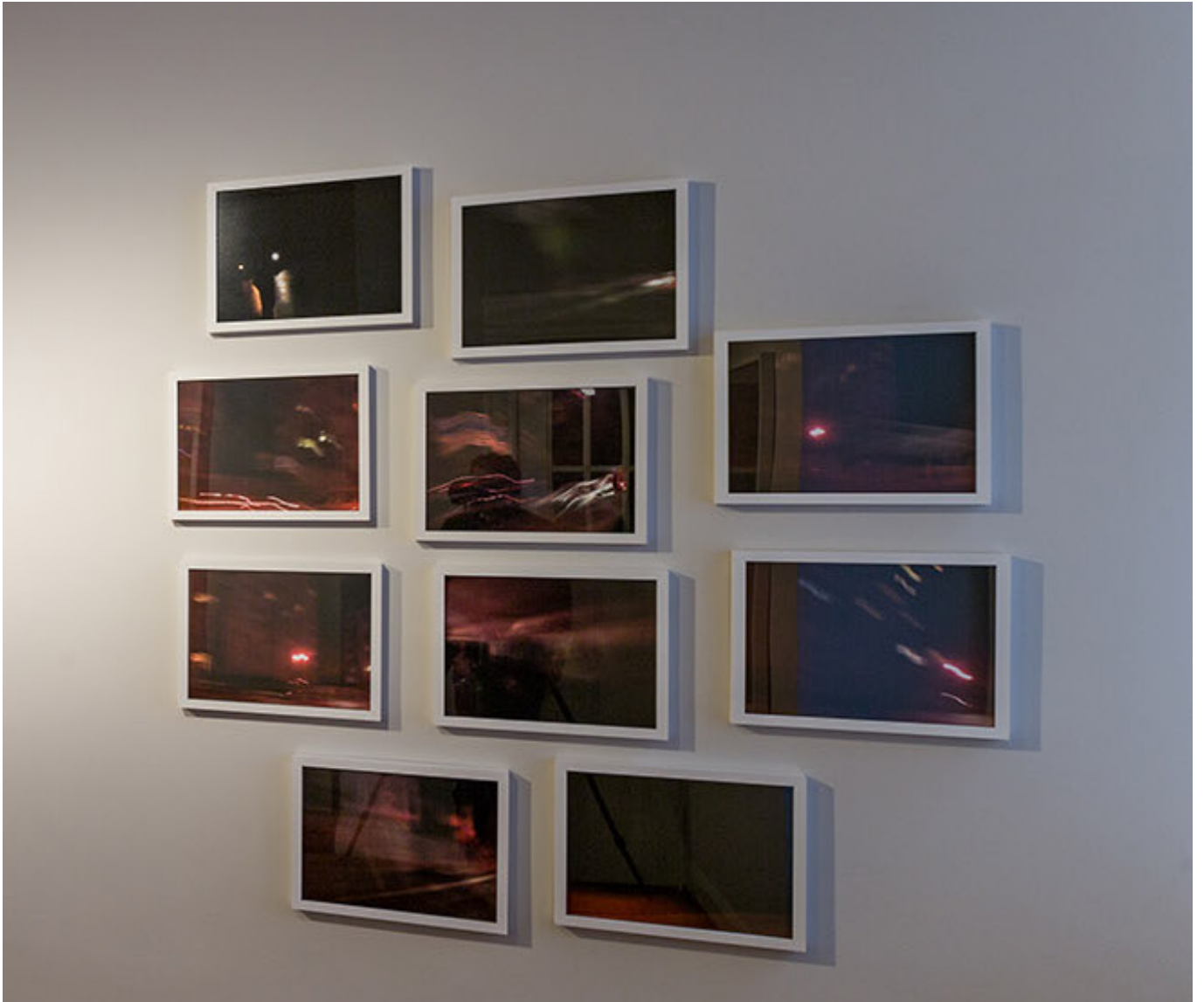
DIRTY MINIMAL #45.8.1-10 – NIGHT DRIVE STILLS , 2007/16 10 Light-Jet-Prints, je / each 30 x 40 cm, Auflage / edition: 5 + 2 A.P. Deutsch-tschechische Grenze / German-Czech border